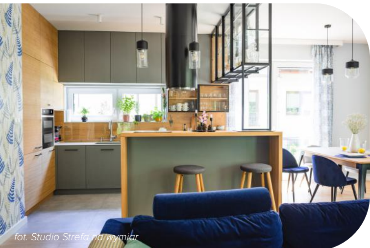
fol. Studio Strefa na wymiar

W doborze kolorów frontów kuchennych znaczenie ma kilka kwestii. Przede wszystkim liczy się nasz gust – tak byśmy we własnej kuchni zawsze czuli się dobrze . Nie bez znaczenia jest też symbolika kolorów – ona również będzie miała niebagatelny wpływ na nasze samopoczucie. Trzecia kwestia to styl, w jakim urządzona jest nasza kuchnia . Fronty meblowe – zarówno ich barwa, jak i sposób wykończenia – powinny korespondować z ogólnym wystrojem pomieszczenia, a kolorowa zabudowa – podkreślać jego styl.