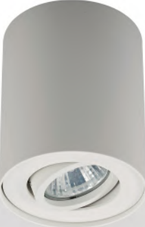
Zuma Line 20038-WH