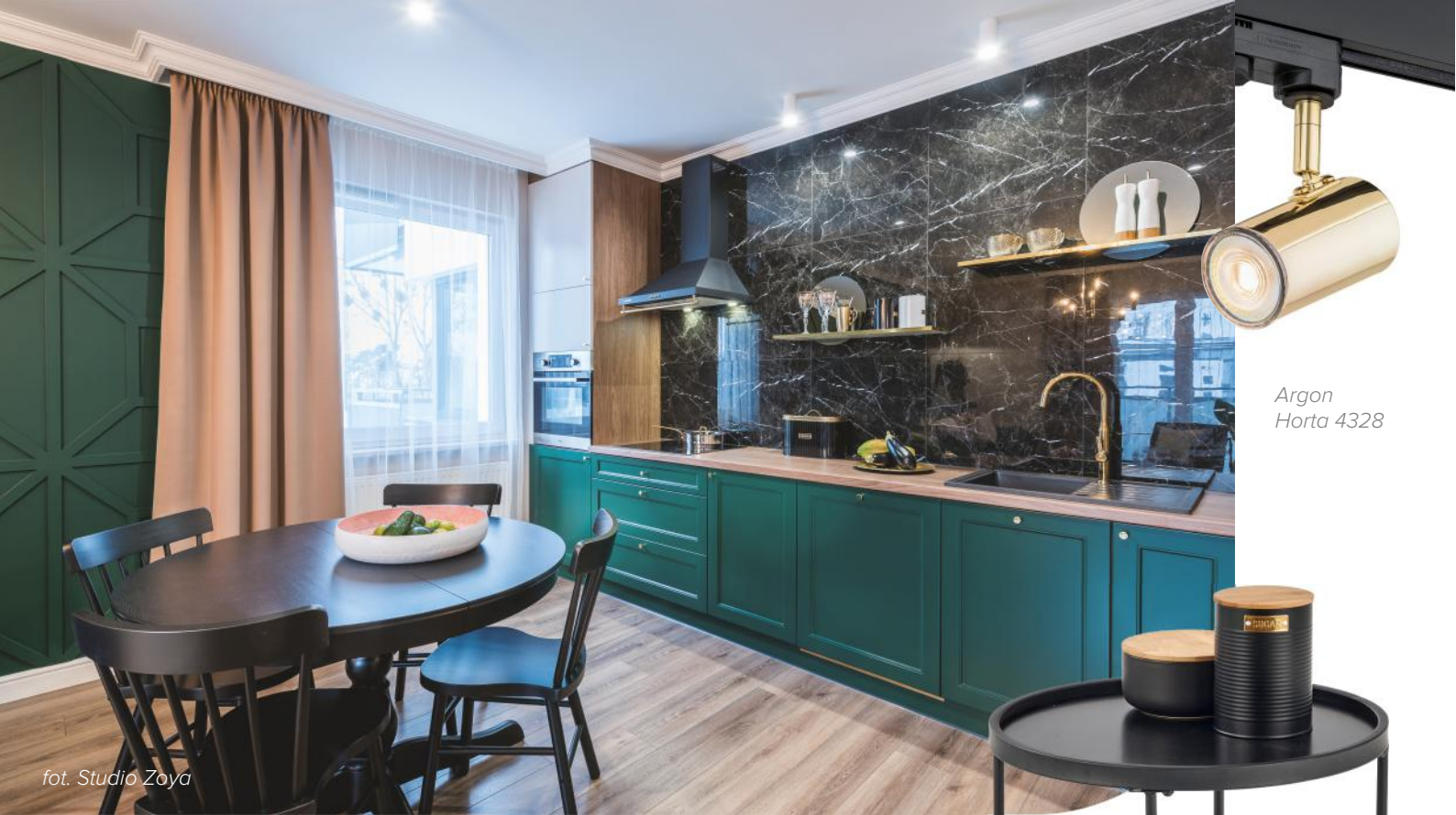
Argon Horta 4328