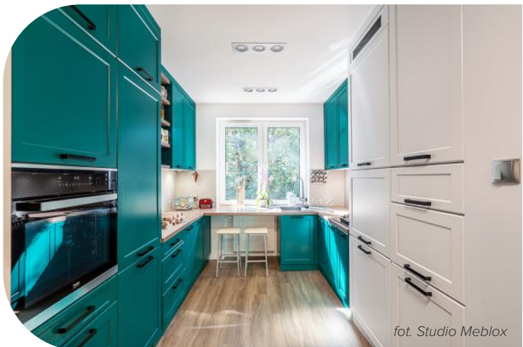
fol. Studio Meblox