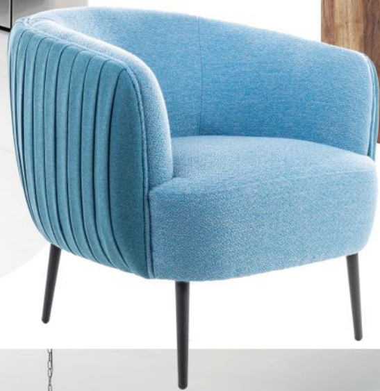
BiuroStyl 306S orzec amerykański