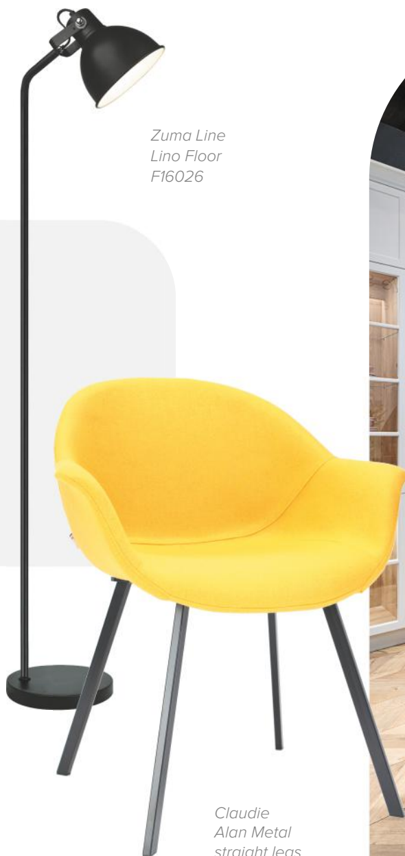
Zuma Line Lino Floor F16026