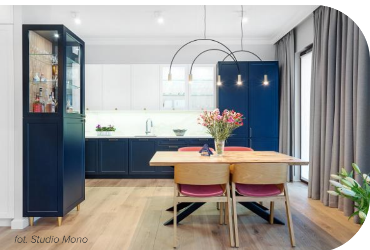
fol. Studio Mono

Jednokolorowa kuchnia, duotone czy zabudowa w kolorach tęczy – pomysłów na kolorowe fronty kuchenne nie brakuje, a barwne połączenia wracają do wnętrzarskich trendów . Łączenie kolorów to sposób na ożywienie pomieszczenia i wprowadzenie do niego pozytywnej energii. Monochromatyczne zabudowy, co prawda, nie wyjdą szybko z mody, jednak coraz częściej tęsknimy za nieco bardziej radosnymi aranżacjami, a kolorowe fronty kuchenne to idealny sposób na to, by nasze pragnienia zaspokoić. W zależności od upodobań możemy postawić na mocne barwy albo pastelowe kolory – ważne, by nie było nudno, a.... kolorowo!